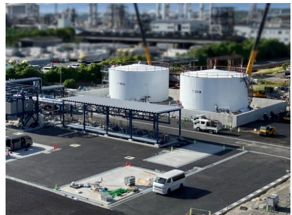
SAF の原料となる廃食用油受け入れ施設 (コスモ石油堺製油所構内)