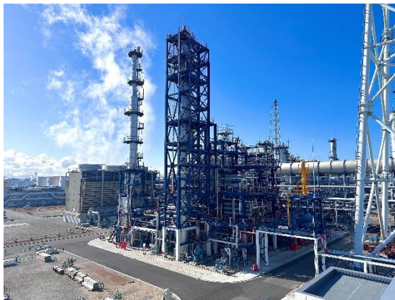
完工した SAF 製造装置 (コスモ石油堺製油所構内)

※NEDO ホームページ： https://www.nedo.go.jp/koubo/FF3_100312.html