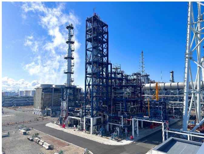
SAF 製造装置（コスモ石油堺製油所構内）

コスモエネルギーグループは「2050年カーボンネットゼロ」をめざしており、日本初の国産 SAF 供給に向けてサプライチェーンを構築しています。また、SAF 原料への再利用を目的として、サービスステーションでの廃食用油の市民回収実証を継続的に展開するなど、社会全体の機運醸成も後押ししています。今後も、脱炭素化や循環型社会の実現を重要なテーマと認識し、社会的課題の解決と企業の持続的発展をめざすとともに、引き続き航空輸送における SAF 活用を推進し、資源循環とサステナブル社会の実現に貢献してまいります。