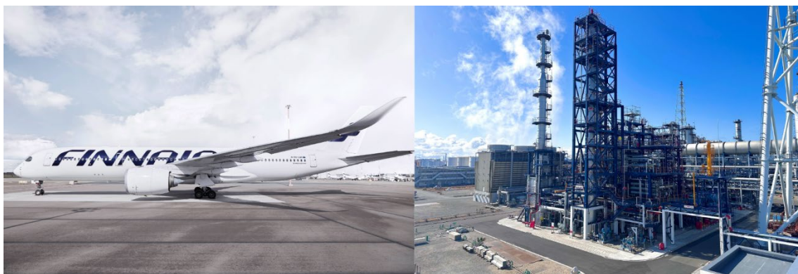
フィンエアーの機体と SAF 製造装置（コスモ石油堺製油所構内）