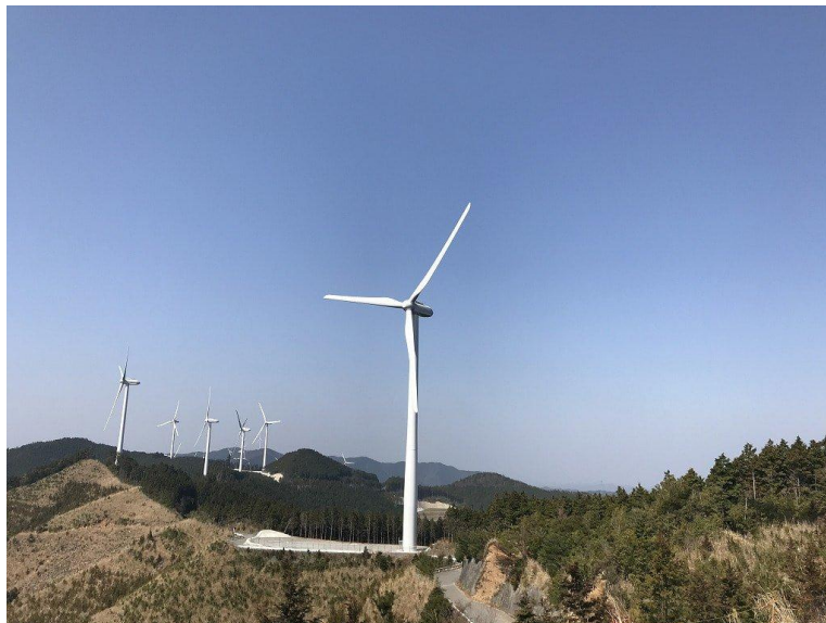
(中紀ウィンドファーム)

※PPA：Power Purchase Agreement（電力購入契約）の略称