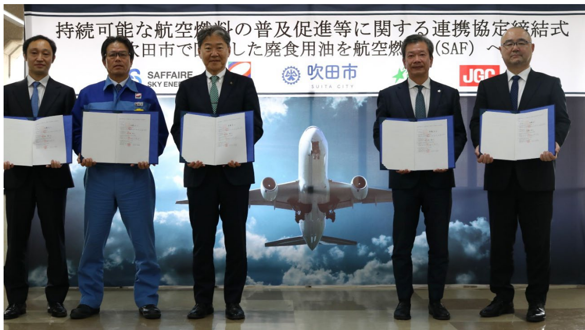
協定締結式の様子

なお、本協定に基づいて吹田市が SAF の原料向けに提供する廃食用油は年間でおおよそ27,000 リットルを見込んでいます。これは、自治体が SAF 原料に再資源化していく排出量としては、全国で最大となる見込みです。