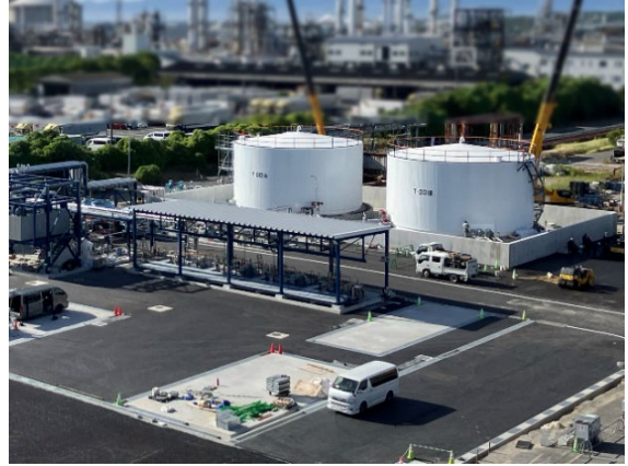
SAF の原料となる廃食用油受け入れ施設 (コスモ石油堺製油所構内)