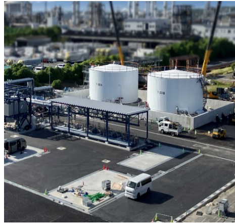
SAF の原料となる廃食用油受け入れ施設 (コスモ石油 堺製油所構内)

※1 ISCC(International Sustainability and Carbon Certification : 国際持続可能性カーボン認証) : 持続可能性認証スキーム (SCS) のひとつで、ドイツに所在する機関です。