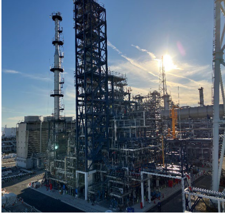
建設中の SAF 製造装置 (コスモ石油 堺製油所構内)