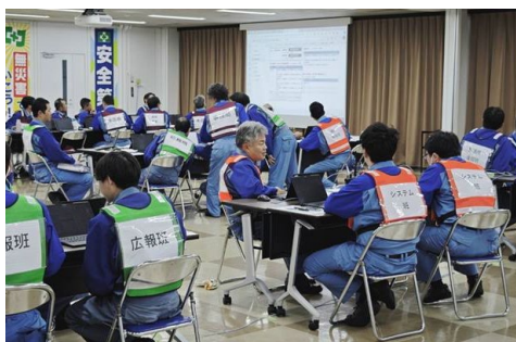
<堺製油所での訓練の様子>