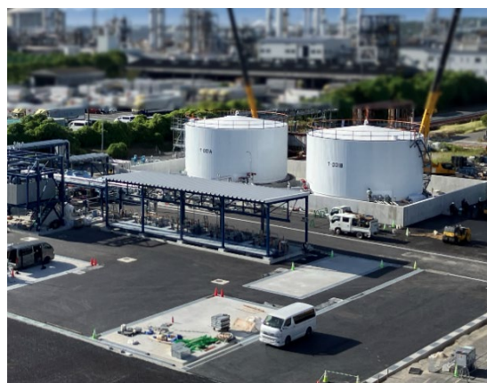
SAF の原料となる廃食用油受け入れ施設 (コスモ石油堺製油所構内)