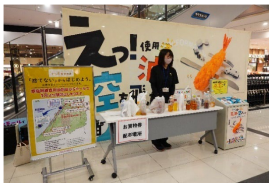
廃食用油回収の様子