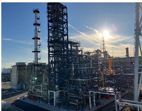
建設中の SAF 製造装置 (コスモ石油堺製油所構内)

※NEDO ホームページ URL： https://www.nedo.go.jp/koubo/FF3_100312.html