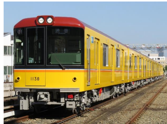
東京メトロ銀座線 1000 系車両