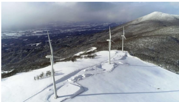
姫神ウィンドパーク